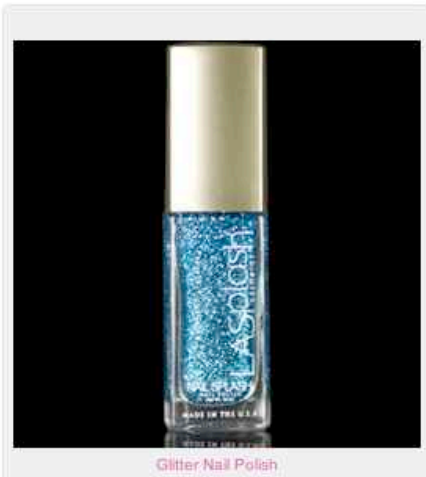
Glitter Nail Polish

Si vous voulez avoir LA couleur de vernis à ongles que vous cherchiez, hé bien ne cherchez plus! LASplash propose 65 nuances de vernis à ongles pailleté (Glitter Nail Polish) et 91 régulier (Nail Polish). J'ai essayé un bleu électrique magnifique sur mes ongles d'orteils, la couleur Blue Splash 12050, et on m'a complimenté, car on les voit de loin! Les vernis sont environ 4$.